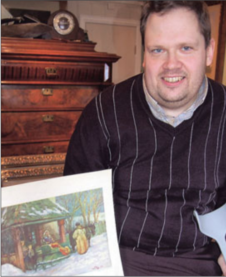
Motivet er hentet fra Tokstad gard, «Den lille skal til dåpen» og originalen er malt av Wilhelm Peters.